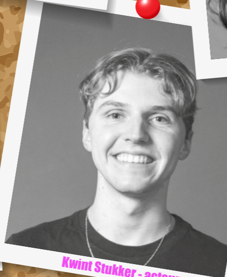
Kwint Stukker - acteur