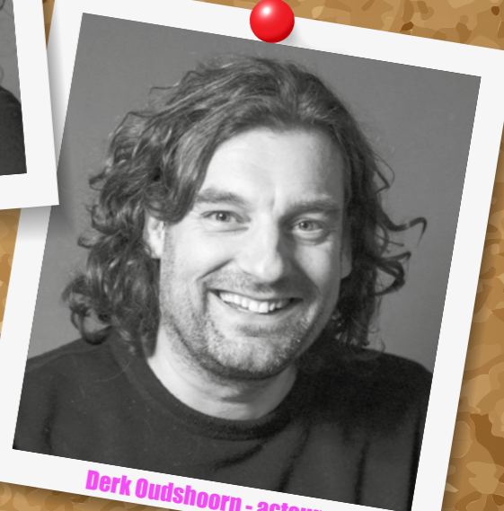
Derk Oudshoorn - acteur